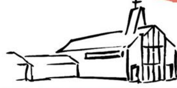
HL. HERZ JESU TOSTEDT