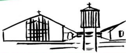
ST. MARIEN EGESTORF